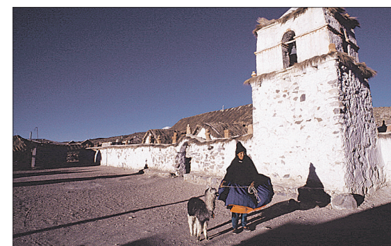
Von der nordchilenischen Hafenstadt Arica geht es die CH11 stetig und immer mühsamer bergauf: Putre am südwestlichen Fuß des Taapaca-Vulkans liegt auf dem Weg der Tour, ein Ziel ist der Lauca-Nationalpark. Bild Mitte: schlafende Flamingos am Salzsee Surire.